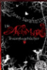
Die Nachtmahr Traumtagebücher