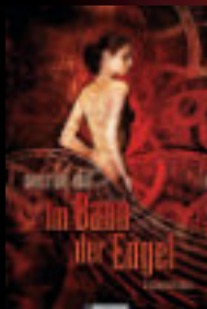
Im Bann der Engel